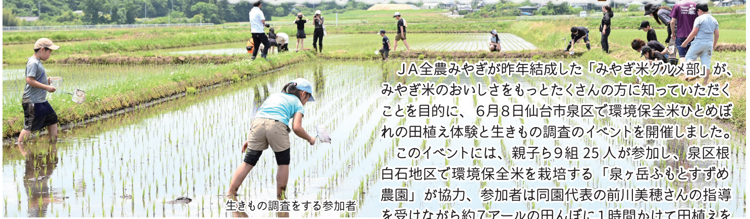
生きもの調査をする参加者

JA全農みやぎが昨年結成した「みやぎ米グルメ部」が、みやぎ米のおいしさをもっとたくさんの方に知っていただくことを目的に、6月8日仙台市泉区で環境保全米ひとめぼれの田植え体験と生きもの調査のイベントを開催しました。