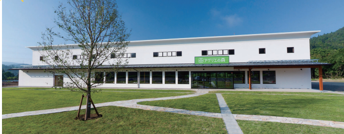
秋保ヴィレッジ アグリエの森