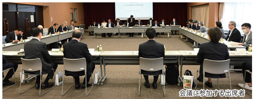
会議に参加する出席者