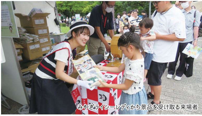
みやぎライシーレディから景品を受け取る来場者