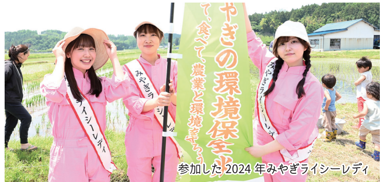
参加した2024年みやぎライシーレディ